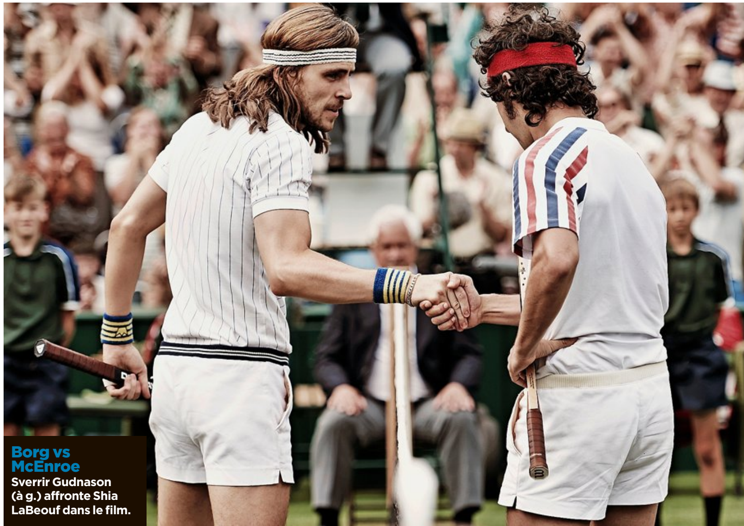
Borg vs McEnroe Sverrir Gudnason (à g.) affronte Shia LaBeouf dans le film.